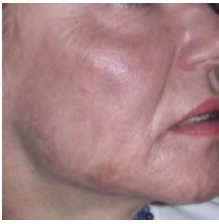
Prima del trattamento