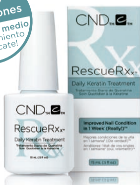
Formato: 15 ml.

160 aplicaciones 12 meses y medio de tratamiento de rescate!