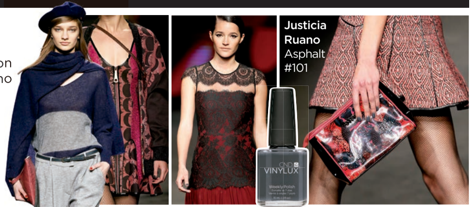
Justicia Ruano Asphalt #101

En la pasarela desfilaban desde los looks más deportivos de Punto Blanco a la feminidad más delicada de Justicia Ruano, pasando por los cuadros y toques étnicos de Custo, looks sobrios de TCN o el talle alto en pantalones de Rita Row.