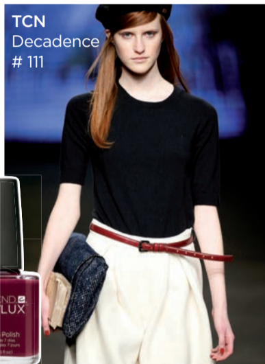
TCN Decadence #111

¡Los colores de mayor éxito en la pasarela fueron CND™ Asphalt y CND™ Rubble!