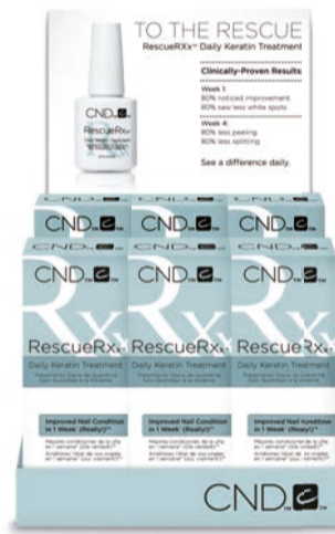
Display 6 unid. de Rescue Rx TM Formato: 15 ml.