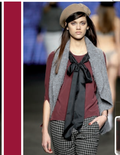
Custo Faux Fur #113